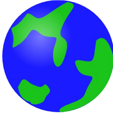
Εικόνα 2.1. Η υδρόγειος